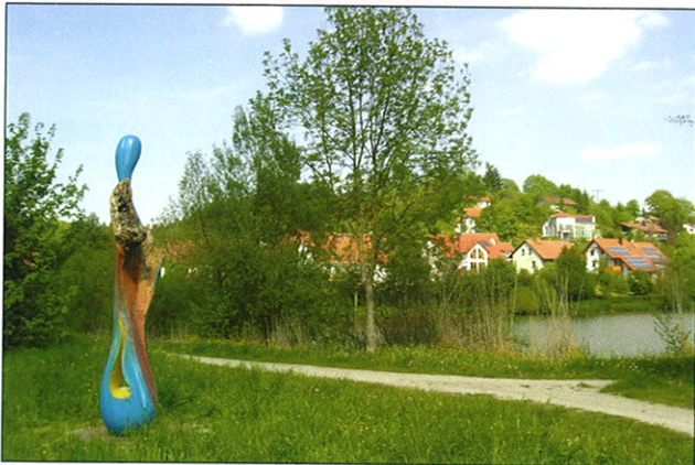
„Eichentropfen“ am Ufer des schön gelegenen Landschaftssees, der dem Oasenweg angegliedert ist.

Allen Förderern des Weges und der Stationen sei herzlich gedankt.