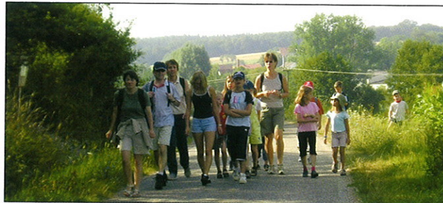
Freizeitgestaltung auf dem Oasenweg