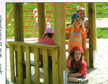
Spiel- und Erlebniszone

An der Steinach gibt es eine Flachwasserzone zu entdecken und am Ortsrand von Mittelsteinach (Talauen-Radweg Nr. 4) eine liebevoll angelegte Spiel- und Erlebniszone.